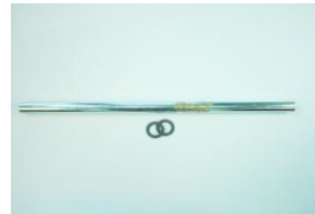
DAA0675, takapyörien akseli