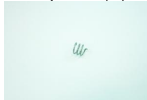
DAA0581, hajoitus suuttimen jousi