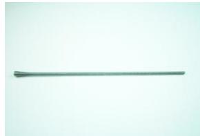
DAA0684, spiraali poltinkahvan