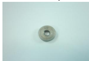
DAA0695, langan syöttörulla