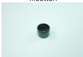
DAA0688, eristin kahvaan