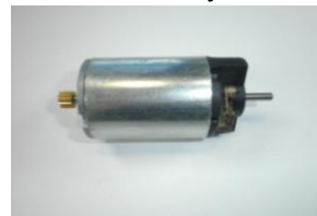
DAA0625, langansyöttölaiteen moottori