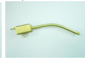
DAA0689, poltinkahvan kaula