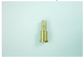
DAA0578, kaasun hajoitussuutin