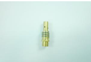
DAA0686, kaasun hajoitussuutin