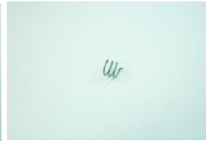
DAA0687, hajoitus suuttimen jousi