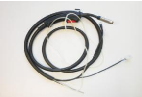
DAA0696, poltin täydellinen