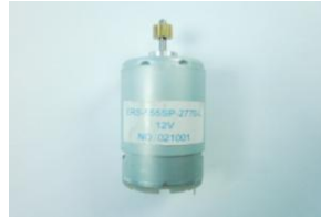
DAA0677, langansyöttölaiteen moottori