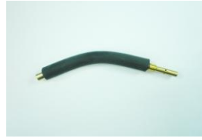
DAA0570, poltinkahvan kaula